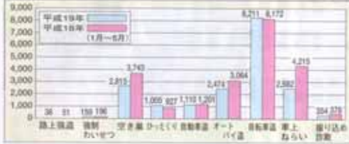
街頭犯罪等の発生状況対比表

◆県内の犯罪認知数 神奈川県内における 刑法犯の認知件数(殺人 が把握した刑法犯事件 の発生件数)は、平成十 四年(一九九七年)十二 月に過去最悪の数字を記 録しましたが、以降、県 民の皆様方の協力をい ただきながら治安回復 に向けた諸対策を推進 してきた結果、平成十八 年の認知件数(十二万 千七百三十三件)は平成十四 年と比べて、六万七千四 百七十件(35.5%)減 少しました。 今年に入ってから五月 から五月末日まで、暫定 値ではありますが、前年 の同時期と比較して、四 千九百七十三件(9.9%) の減少となっています。 このように全体的には 刑法犯の認知件数は減