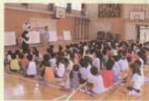
誘拐防止教室(港南)