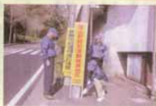
防犯看板設置活動(葉山)