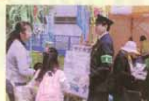
青空防犯教室(磯子)