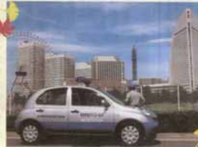
防犯/Q-ロール車(県防犯協会連合会)