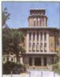
神奈川県庁(キングの塔)