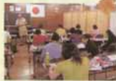
地域ボランティア育成活動(中郡)