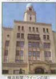
横浜税関(クイーンの塔)

神奈川県庁(キングの塔) 日本大通りに面し、その風情がらもまさに「キング」の存在。五重塔をイメージさせる塔は開港のシンボリック存在です。 開工 明治三十三年十一月 竣工 明治三十九年九月