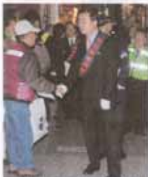
防犯ボランティアの方々と警察官

近年、携帯電話は子どもの間にも急速に普及しています。子ども自身が携帯電話を欲しがることが多いようですが、「子どもと簡単に連絡がとれる」「子どもの居場所を確認できる」など、犯罪被害防止のために携帯電話を持たせるご家庭も増えてきています。