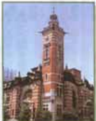
横浜市開港記念会館(ジャックの塔)