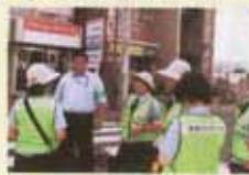
自転車盗防止キャンペーン(鎌倉)