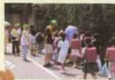
子ども見守り活動(葉山)