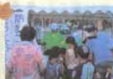
防犯コーナー開設(大和)