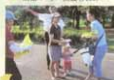
子ども見守り活動(国子)