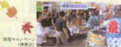
防犯キャンペーン(神奈川)