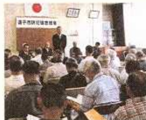
防犯協会総会(逗子)