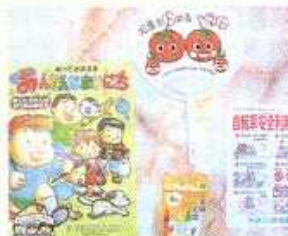
防犯広報ウチワ(大和・綾瀬)