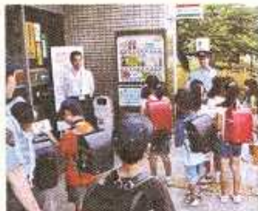
子ども110番の家訪問(大船)