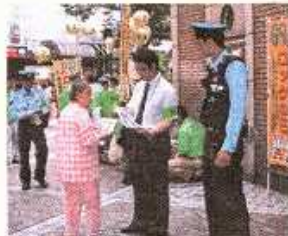
駅頭キャンペーン(西区)