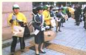
1日女性警察官9人キャンペーン(伊勢佐木)