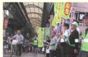
街頭防犯キャンペーン(南)