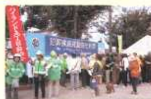
犯罪撲滅決起大会(浦賀)