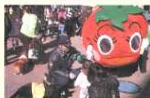
防犯キャラクタートマトちゃん(大和・綾瀬)