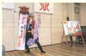
振り込め詐欺撲滅出陣(大船)