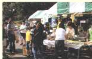
市民まつり防犯コーナー開設(逗子)